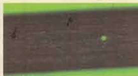
②微細加工 φ0.5mmのシャープペンシル の芯に0.045mmの穴アケ。