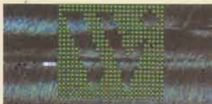
①微細加工 ステンレスの板に直径0.052mmの穴アケ 約200ヶ[W]文字残し一辺約3mm角。

松本市島内の本社工場、波田工場(平成25年1月15日より操業開始)を合わせ、NC旋盤・マシニングセンター・微細加工機・放電加工機等約60台のCNC加工機を主要生産設備としカールツァイス製三次元測定機をはじめ最新の計測機器群を駆使し精度の検証、また超鋼合金から一般金属材料、エンブラ(樹脂)材料等の切削、研削加工、外観製品へのYAGレーザー加工、機器部品のユニット組立・精度調整等、総合的な複合技術の提供をしております。